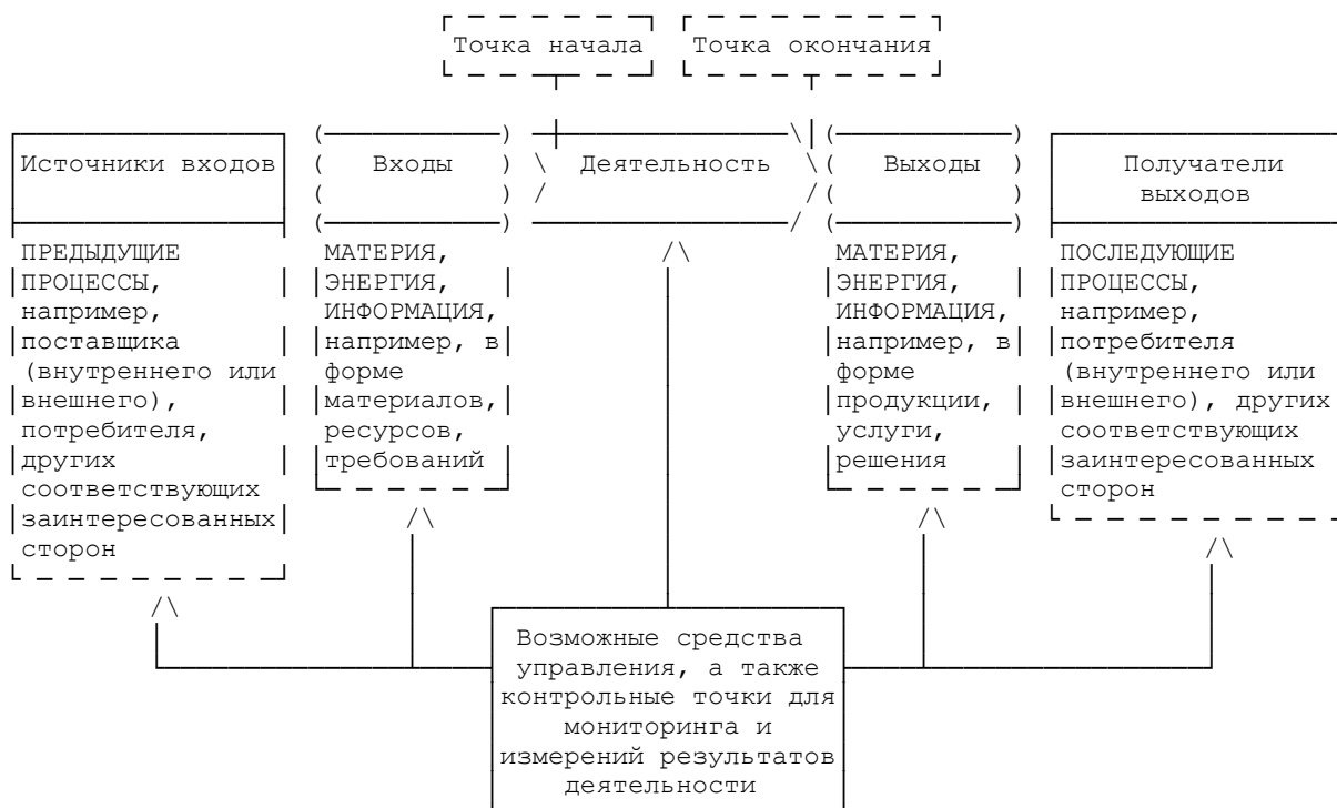
Рисунок 1 - Схематичное изображение элементов процесса

Рисунок 1 дает схематичное изображение любого процесса и иллюстрирует взаимосвязь элементов процесса. Контрольные точки мониторинга и измерения, необходимые для управления, являются специфическими для каждого процесса и будут варьироваться в зависимости от соответствующих рисков.